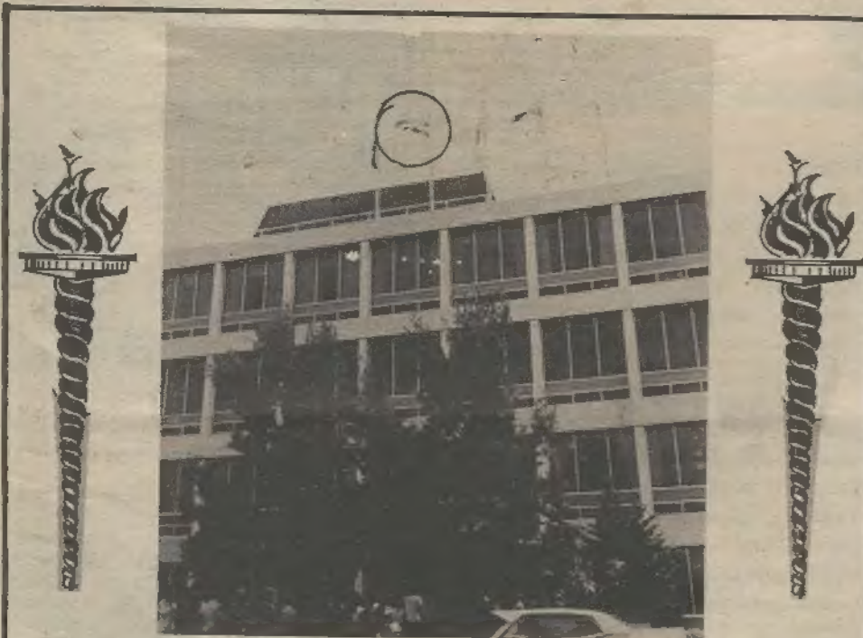
Gradska Vijećnica grada Fremantle po prvi puta u svojoj povijesti ponosno je bila iskičena hrvatskom zastavom. Kao što slika prikazuje, zastava je stajala na počasnom mjestu, gordo se je vijala, kao da je želila svima doviknuti...još sam tu i nikakova sila na svijetu me ne može uništiti, jer predstavljam simbol, pravde, uspjeha i neugasive slobode!

Riječ o svečanom primanju kod gradonačelnika grada Fremantla. Ovo se je djelomično držalo u tajnosti, jer si zaista nije mogla dozvoliti da netko u zadnji čas pokvari ono na čemu se je sa toliko ljubavi i požrtvovnosti radilo